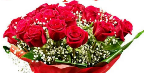
Муж, дочь, внуки, правнуки.

Дорогую, любимую сестру, тетю, бабушку Лидию Иосифовну БАЛАШОВУ поздравляем с Юбилейным днем рождения, с днем 80-летия!