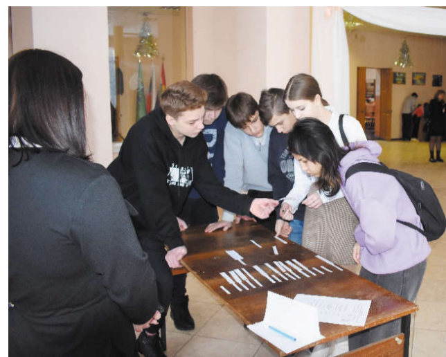
да «Наш выбор» средней общеобразовательной школы № 2 п. Бабынино;

Диплом победителя и памятные призы получила коман-