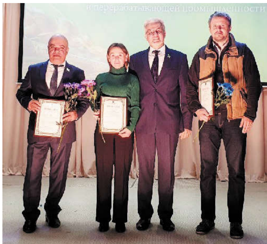
Окончание. Начало на 1-ой стр.