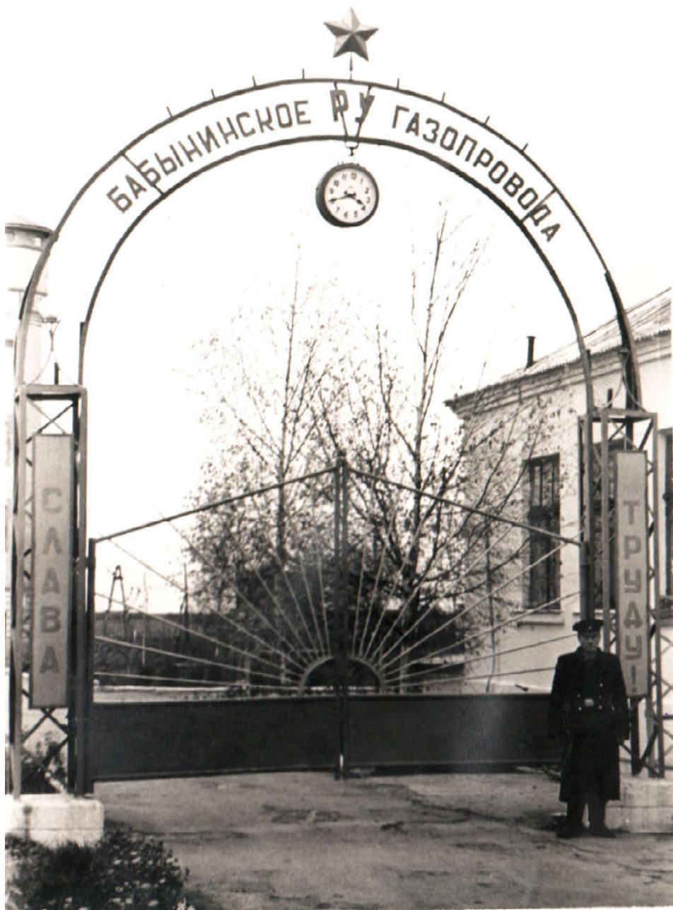
Центральный вход на газокompрессорную станцию (1961 год).