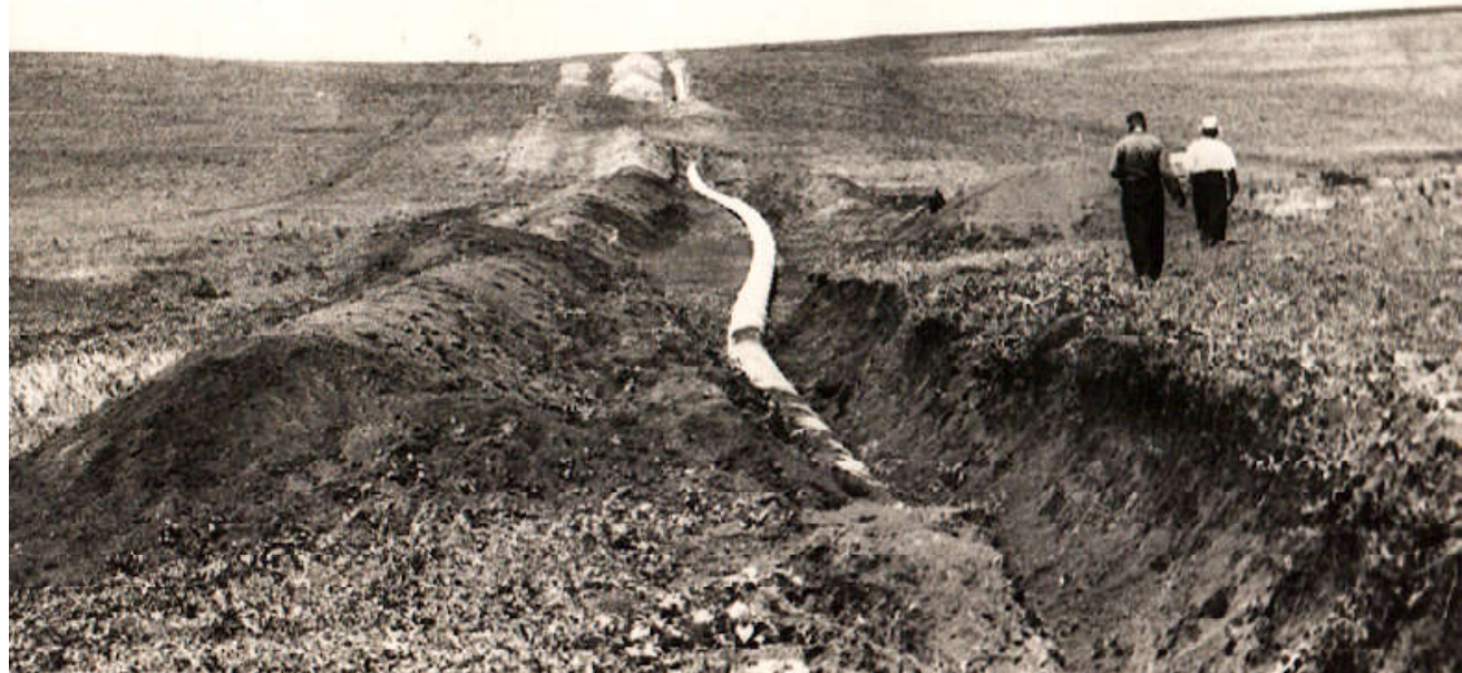
Строительство газопровода Дашава-Киев-Брянск.

Трудно, очень трудно было нам. Грелись у костров. После работы шли в деревню, где размещались по 5-6 человек