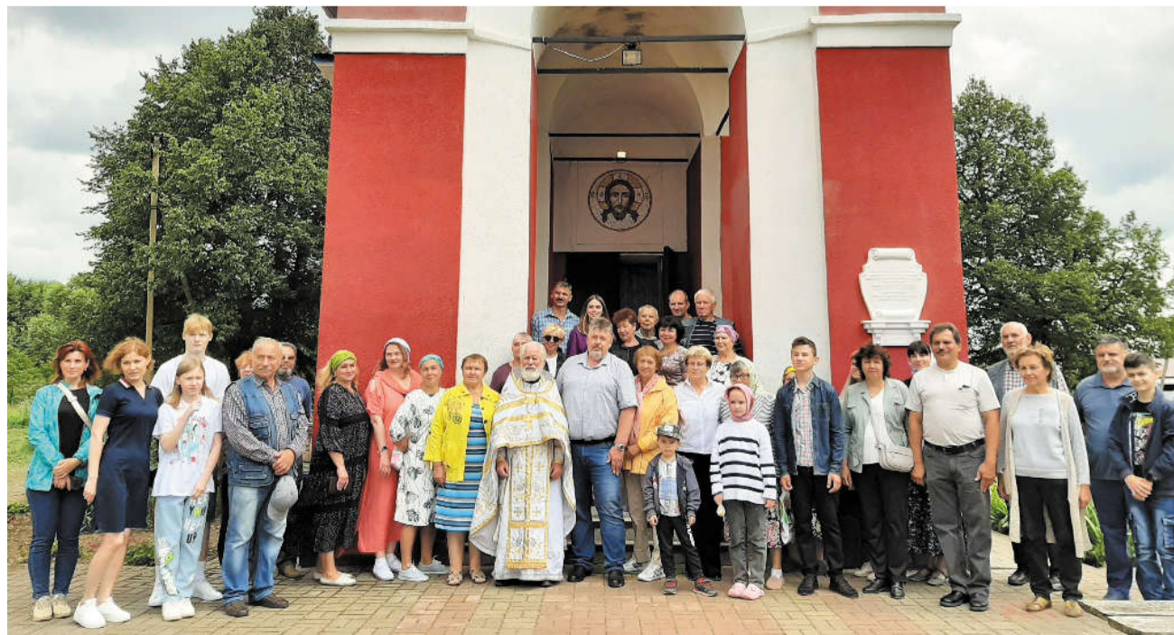
портрет Д.А. Делянова, кисти художника Д. Доу (Государственный Эрмитаж, Санкт-Петербург).

Использовалась литература: Ст. «Калужские усадьбы Утёшево и Железники и их владельцы» (авт. С.И. Кривов, О.А. Кузьмина).